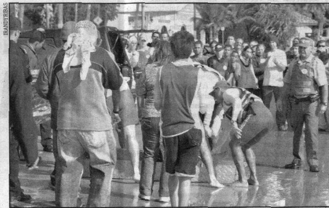
O corpo do surfista foi encontrado boiando e encaminhado ao IML, onde familiares o reconheceram