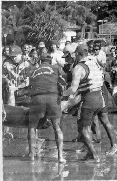
Após 77 horas de buscas, surfista foi retirado do mar sem vida